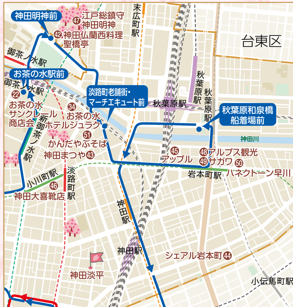
スタンプラリー実施店 詳しくはP26、27をご覧ください

専門店がひしめくサブカルチャーの町・秋葉原、文化財や史跡が多く残り老舗の飲食店が点在する神田、かつて大名屋敷のあった場所であり今では経済の中心地でオフィス街の大手町。さまざまな顔を覗かせるこのエリアは、江戸の伝統文化を守りながらも新しい風を取り入れ、新旧の入り交じった魅力あるエリア。