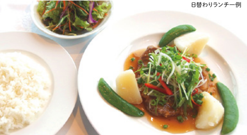
日替わりランチ一例

千鳥ヶ淵を見下ろすお洒落な展望レストラン 大学のお洒落な展望レストランでおいしい料理をご堪能ください。 シェフこだわりの数量限定日替わりランチが大人気。 また、千鳥ヶ淵の桜を見下ろすこともできます。