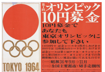
ポスター「第1回オリンピック10円募金」昭和36年(1961)

来たる2020年には東京で2度目となるオリンピック・パラリンピックが開催されます。1940年の幻の大会、1964年のオリンピック・パラリンピックについて誘致や開催に尽力した人々の軌跡を紹介します。