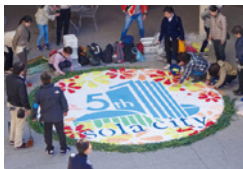
※画像は昨年のものです。