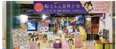
昨年開催時の様子